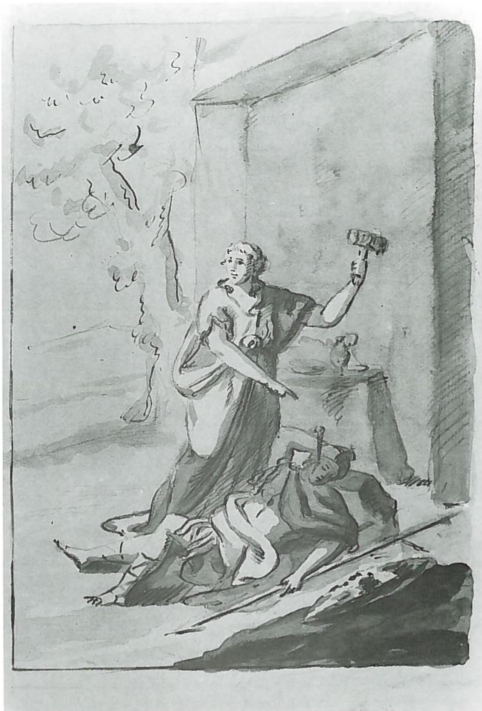
Fig.222—Nº inv.1669/P. Pedro de la Cruz: Jael da muerte a Sisara.