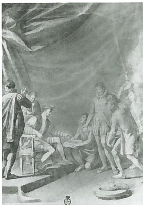
Fig.219-Nºinv.1666/P. Antonio Menezo: Juan Sebastián Elcano ante Carlos V.

Tanto la indumentaria como el ambiente teatral y aparatoso refleja cómo la estética barroca sigue siendo una constante, aunque no tan marcada como hemos podido ver desde los primeros años de 1752 a 1770 aproximadamente. Un gran salón, cortinajes amplios y