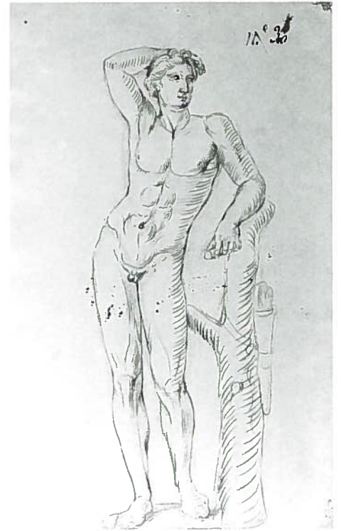
Fig.224–N°inv.1670/P. Joaquín Gallardo: Apolino .