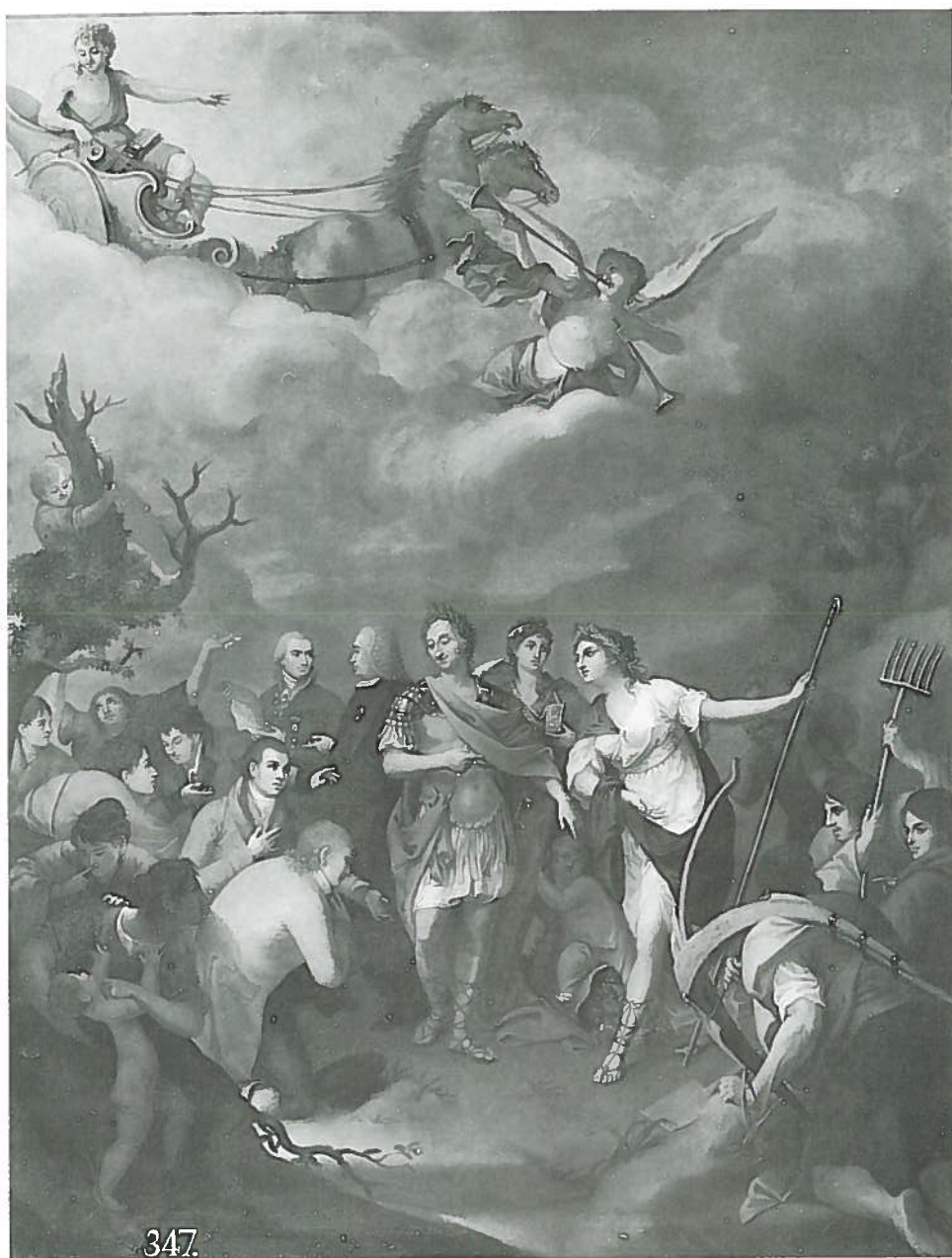
Fig.215-Nºinv.254. José Alonso del Ribero: Carlos III y los colonos de Sierra Morena .

José Odriozola nace en 1785. Se dedicó a la