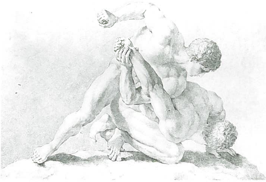
Fig.223–N°inv.1673/P. Joaquín Gallardo: La lucha de Florencia .