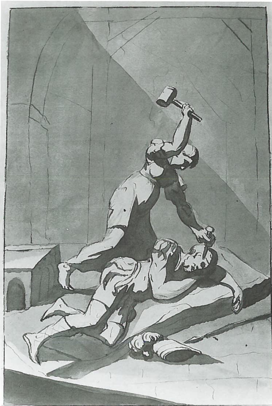
Fig.221–N°inv.1668/P. Antonio Menezo: Jael da muerte a Sísara.