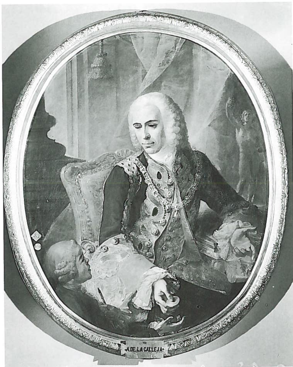
Fig.26-Nºinv.722. Andrés de la Calleja: José de Carvajal y Lancaster entrega la medalla a un alumno.

“No se hallan a propósito las piezas del Nuevo Palacio p a la funcion de Premios al estar ocupadas las del año precedente con muebles y pint as de la Casa Rl. y los demas incapaces todavía de servir: De lo cual informé al S r Protector p a que haciendolo presente al Rey, resolviera S.M. se celebre esta funcion en el Teatro del Seminario de Nobles...” 15 .