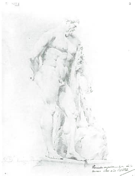
Fig.31-Nº inv.1512/P. Domingo Alvarez: Hércules Farnesio .

La estatua del Hércules Farnesio es una conocida y monumental escultura (3,17 metros) que se atribuye a Lisipo Glykon por su semejanza con otras esculturas de este artista y de su escuela, como el Sileno que porta en sus brazos un Baco niño (s. IV-III a. C.). Se sabe que fue una de las esculturas cuyo molde trajo Velázquez de Italia y que se volvió a pedir ya en tiempos de la Academia, probablemente por el deterioro de la anterior. Por otro lado, fue uno de los modelos más utilizados para la enseñanza en esta corporación. La escultura original se conserva en el Museo de Nápoles.