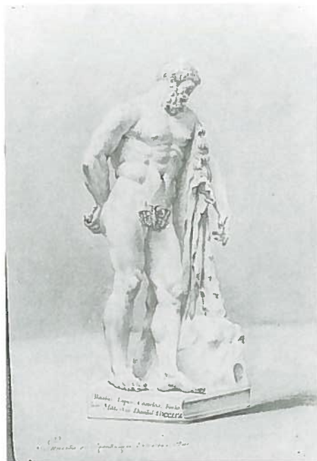
Fig.32-Nº inv.1513/P. Blas López Castelaio: Hércules Farnesio .

El tema que presenta este dibujo es el de la prueba de pensado: "El Rey Wamba rehusando la Corona, que postrados a sus pies le ofrecen los Prelados y Grandes,