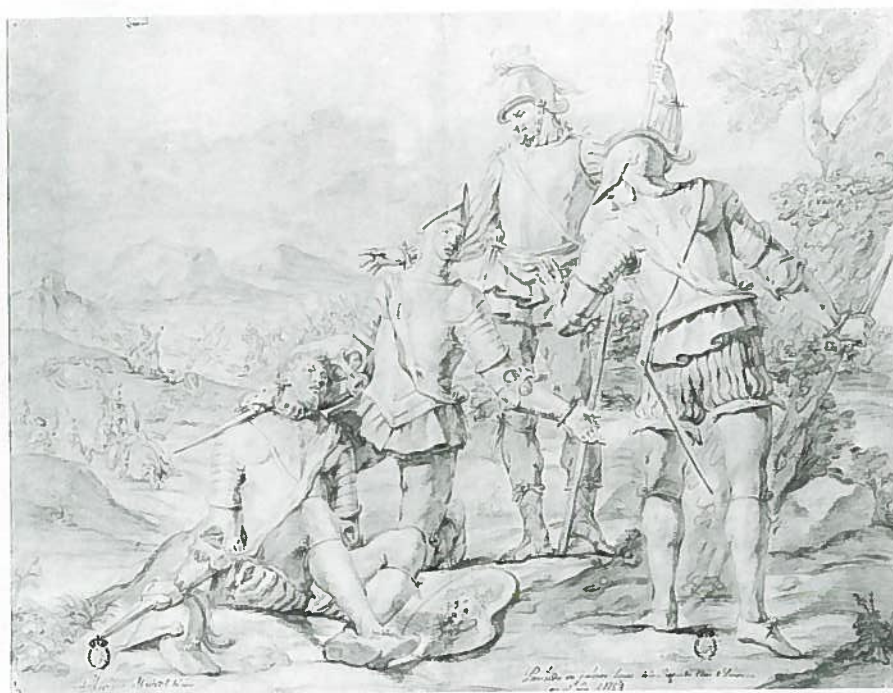
Fig.29–Nºinv.1510/P. Mariano Salvador Maella: Julio Mansueto herido por su hijo en Cremona.

Este es uno de los casos en que se puede observar la evolución de un artista a través de los premios. Maella, que se presenta en 1753 a la tercera clase y realiza dos copias de estatuas, desarrolla en este caso toda una composición con ejemplos de mayor dificultad –como el escorzo que realiza en el personaje que de espaldas al espectador se dirige al grupo–, en general más compleja