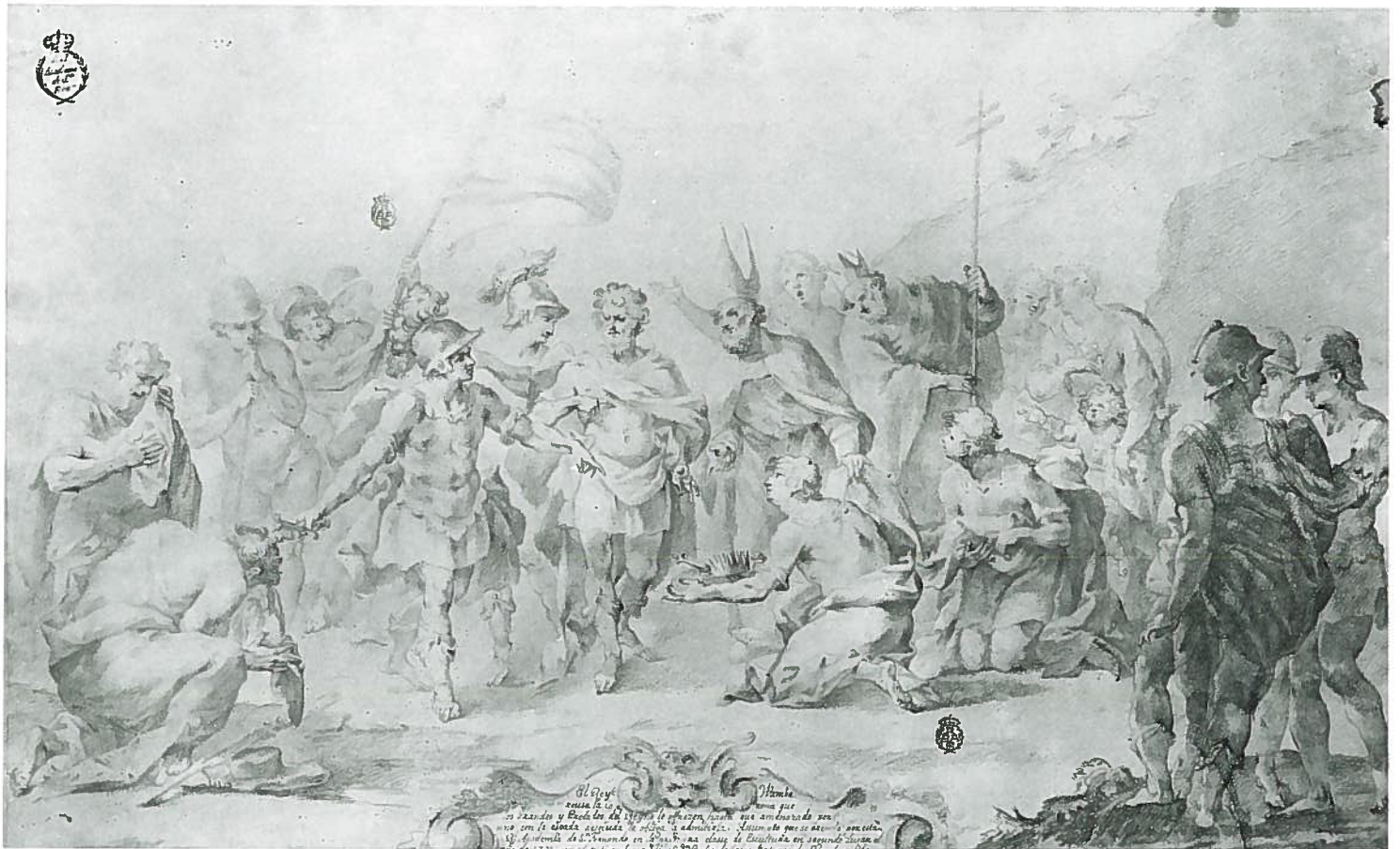
Fig.34–Nº inv.1515/P. Carlos Salas: Wamba rehusa la corona.

guna manera quería aceptar aquel cargo. Excusábase con su edad, que era muy adelante; pedía con lágrimas no le cargasen sobre sus hombros peso tan grave [...] Como no desistiese ni se allanase, cierto Capitan principal, hombre denodado, con la espada desnuda le amenazó de muerte sino aceptaba [...] Doblegóse Wamba con estas amenazas; pero de tal manera aceptó la elección, que no quiso dejarse un- gir, como era de costumbre, antes de